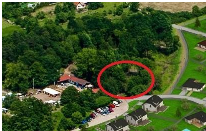
Lokalita - obec Železné - Záhomí

Cílový stav zajistí uvolnění kapacit MŠ v Tišnově pro potřebu města a zajistí umístění dětí ze zúčastněných obcí v novém předškolním zařízení. Nejbližší předškolní zařízení je ve městě Tišnově nebo v Lomnici u Tišnova. Tato zařízení již delší dobu vykazují nedostatečnou kapacitu v umísťování dětí svých občanů. V rámci výstavby školky vzniknou i prostory pro volnočasové aktivity dětí z přilehlého regionu.